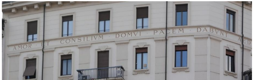
Iscrizione "L'amore e la saggezza daranno la pace a questa casa. Anno di costruzione 1926"

Ce lo ricorda l'iscrizione in latino nel frontespizio che recita "Amor et consilium domui pacem dabunt" "AED MDCCCCXXVI (L'amore e la saggezza daranno la pace a questa casa. Anno di costruzione 1926). E proprio il prossimo 17 giugno 2026 festeggeremo i cento anni con una piccola festa sul terrazzo condominiale.