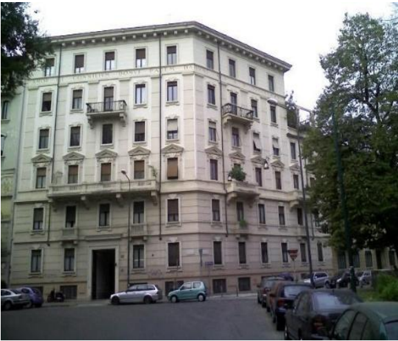
Casa in Via Solari 2