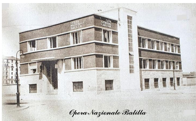
Casa del Balilla

Ma sono soprattutto i ricordi e le immagini in questa casa, della mia gioventù e successivamente della mia vita, che si mischiano intimamente ai ricordi ed ai racconti che mia nonna, mio zio, mio padre e mia madre mi facevano in queste stanze. Tanti frammenti di memoria che ruotano intorno a questa casa in cui ho vissuto per più di settant'anni, momenti belli, altri tristissimi, molti del tutto normali e quotidiani, ma tutti con lo sfondo scenografico delle finestre sul parco, verdissimo, colorato, luminoso e lussureggiante d'estate, pieno delle voci felici dei bambini, spoglio e silenzioso d'inverno, ma talora stupendo e scintillante sotto una bianca coltre di neve.