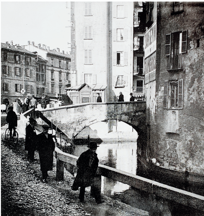
FOTO STORICHE DEL NAVIGLIO DI VIA VALLONE E DELLA CONCA DI VIARENNA