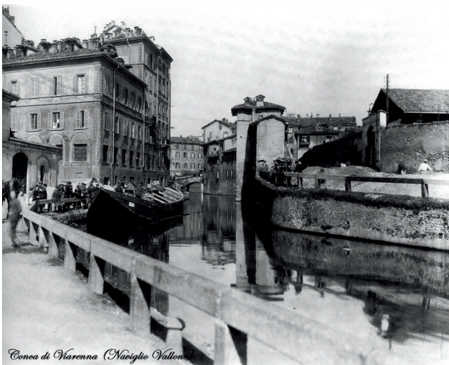
Conca di Viarenna (Naviglio Vallone)