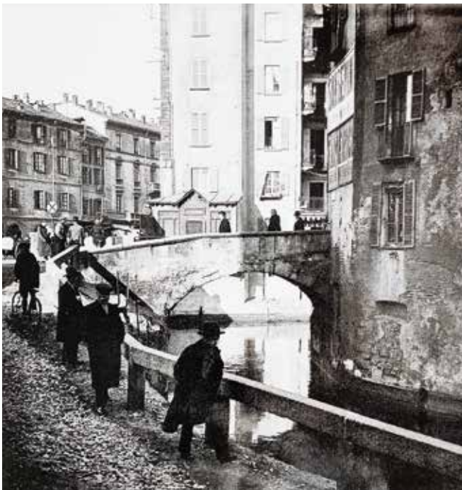
FOTO STORICHE DEL NAVIGLIO DI VIA VALLONE E DELLA CONCA DI VIARENNA