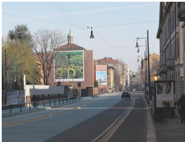
Stato Attuale con sedime naviglio in blu.