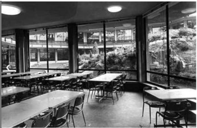
La mensa operai progetto Ignazio Gardella – 1959.