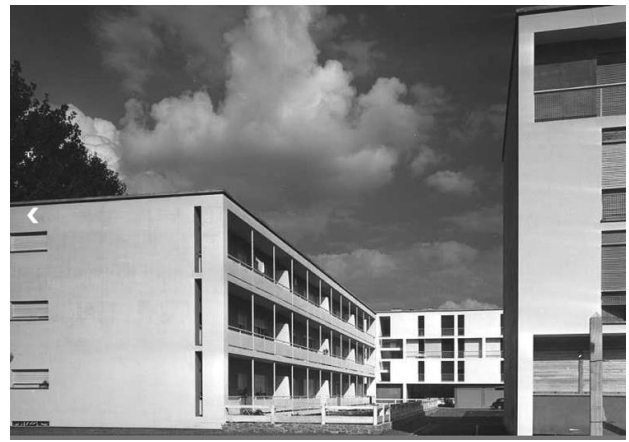
Quartiere di Canton Vesco - 1943/77.