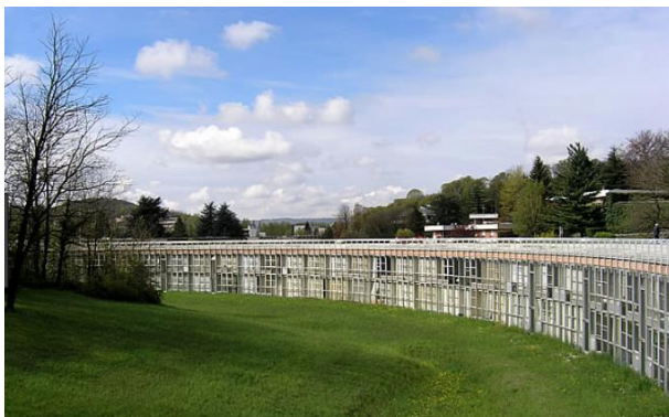
Residenziale ovest Gabetti e Isola – 1968/1971