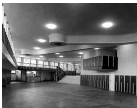
Mensa – arch. Ignazio Gardella

Proseguiremo verso un ampio spazio dialogante con il contesto verde: sapientemente organizzato e progettato da Ignazio Gardella, la “mensa operai” si distingue dalla mensa degli impiegati al palazzo uffici. Seguirà la visita del Centro Studi e della