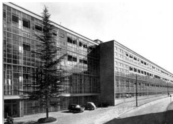
Officine ICO progetto Figini e Pollini - 1937 -1942

Ore 8.00: Partenza con pullman dal parcheggio di Via Mario Pagano. Arrivo a Ivrea verso le ore 10.00. Accoglienza e presentazione della giornata di visita presso le Officine ICO . Visita delle architetture poste lungo via Jervis, asse principale di Ivrea e area “Core Zone” del sito UNESCO. Vedremo i principali edifici riconosciuti di interesse culturale dal Ministero dei Beni e delle Attività Culturali (MiBAC): la Fabbrica dei Mattoni Rossi, dove Camillo Olivetti nel 1896 realizzò la prima fabbrica; i tre ampliamenti