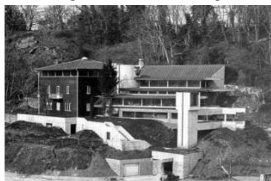
Edificio Sertec – arch. Ezio Sgrelli

creata dall'ingegnere Antonio Migliasso. Sempre nello spirito olivettiano di programmare l'integrazione sociale dei dipendenti vedremo le case del quartiere Castellamonte e l'Unità Residenziale Ovest, conosciuta localmente come “talponia”, che rappresenta l'originale inserimento di una precisa forma geometrica nel contesto