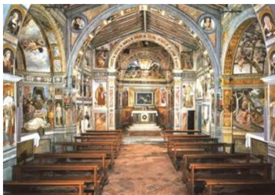
Chiesa di San Bernardino

Non potremo lasciare Ivrea senza essere entrati nella chiesa di San Bernardino affrescata con le storie della vita e