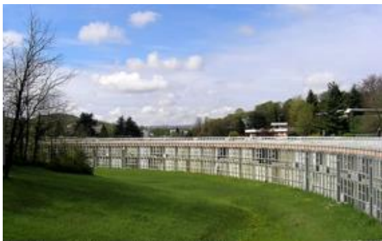
Residenziale Ovest Gabetti D'Isola

geomorfologico abilmente giocato dagli architetti Roberto Gabetti e Aimaro Oreglia d'Isola, con curiosi effetti nel reciproco rapporto tra la disposizione circolare delle residenze e il centro della forma. La mattinata si concluderà con la visita dei due palazzi direzionali di Annibale Fiocchi e di Gino Valle. (Ci si muoverà a piedi). Pranzo al Circolo Canottieri Sirio posto nel quadro naturale di una formazione morenica di grande effetto “la Serra” che disegna al confine con il cielo una linea